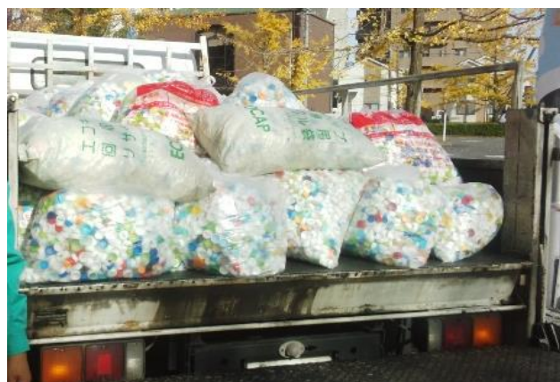
2トントラックがいっぱいです