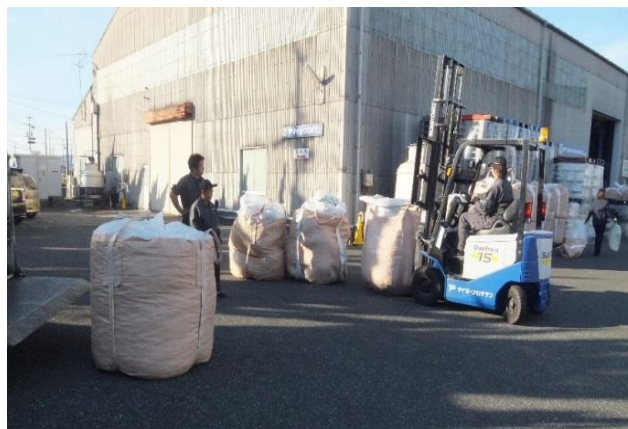
みなさんご協力ありがとうございました！