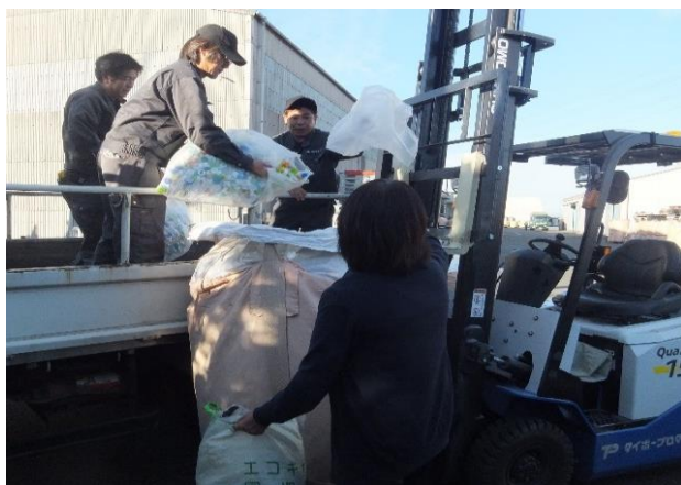
リサイクル工場での搬入作業