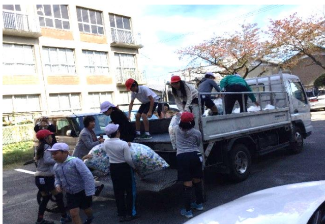
笠松小学校の生徒が回収に参加しました

毎例会ごとにペットボトルのキャップを集め、リサイクル運動に積極的に取り組んでいます。今年度は、岐阜県羽島郡笠松町の笠松小学校に協力していただき、子ども達と共にリサイクルに取り組みました。集まったエコキャップは、岐阜県安八郡輪之内町にある回収工場まで運び、数量547キロ、個数にして235,210個でした。後日、回収したエコキャップが工場ではリサイクルされる過程を、学校に報告しにいきました。ライオンズクラブの環境保全運動が、青少年達の社会勉強のひとつに役立つことを期待します。