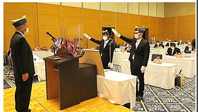
宣誓「ライオンズの誓い」