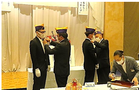
スポンサーからラペルピン授与