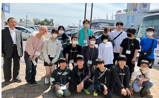
ジュニアリーダー会様ありがとうございました。