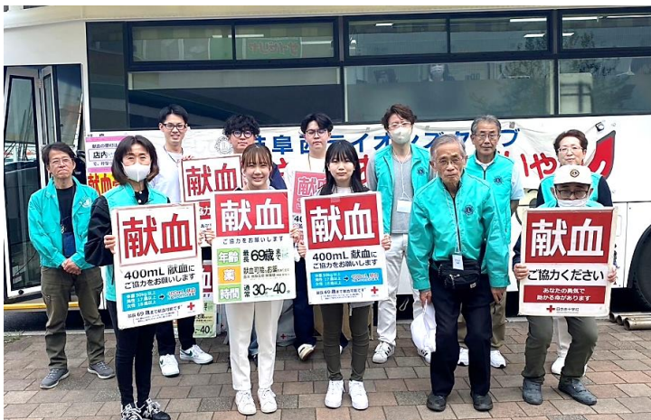
SEOレオクラブメンバーと一緒に呼びかけ

前日には活動に関しての様々な変更もありましたが参加されました会員のご協力もあり無事に終えることができました。最後の採血者を見届けながら16時30分に散会いたしました。